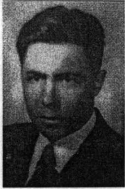
Aleksandr Feklisov. KGB'nin en güvenilir ajanı. Rosenbergları ve Klaus Fuchs'u yönetti.