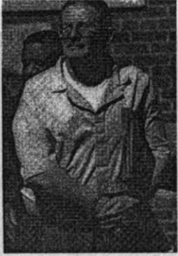
Aldrich "Hazen" Ames. CIA üst düzey yönetici, 1963'te Ankara'da casustu. 1993'te Ankara'dan ABD'ye dönmönce KGB ajanı olarak tutuklandı. Hâlen müebbet cezasını çekiyor.