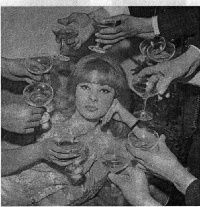
Mandy Rice-Davies. Lord Profumo skandalında "Honey Trap" km. Türkiye'de de çok meşhur bir isim hâline gelmiştir. Şimdi 64 yaşında, anılarını yazıyor.