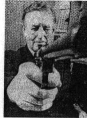
Philby, Moskova'daki evinde.