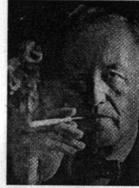
Kim Philby. İngiliz gizli istihbaratını çökerten KGB ajanı. İstanbul üzerinden Moskova'ya kaçırıldı.