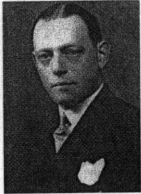
Oswald Rayner. Rasputin'i öldüren İngiliz ajanı. (1909)

CIA'nın kurduğu AKIN Binası. (Amerikan Kürt Enformasyon ağı). Washington DC. (2004)