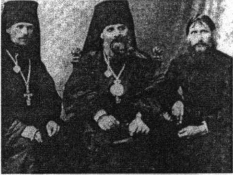
Rasputin sanıldığı gibi cahil bir papaz değildi. Fotoğrafta onu (sağda) Rus Ortodoks KİLsesi'nin başı Piskopos Üiodor ve Piskopos Hermogen ile görüyorsunuz.