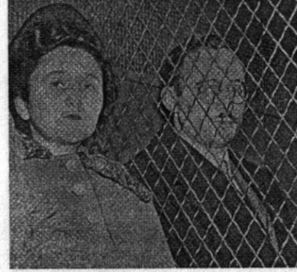
Ethel ve Julius Rosenberg. KGB ajanları. Birlikte idam edildiler.