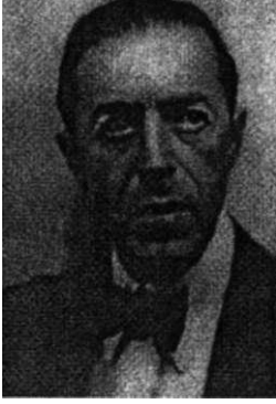
Sir Sydney Reilly. Gelmiş geçmiş en karizmatik casus. Türkiye'de de casusluk yapa. Lenin öldürecekti. James Bond onun yasanımdan kurgulandı.