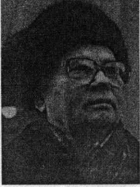
Vladimir Kryuchkov. KGB 'nin güçlü başkanı. Gorbaçov 'a karşı darbe düzenledi. 1988'de bir görüşme yapmıştım.