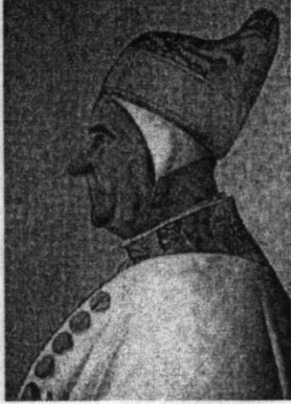
Bruno'yu ihbar eden Mocenigo Hanedanı'nın kurucusu Venedik Dodge'u.