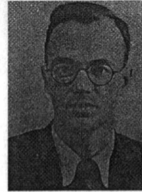
Dr. Klaus Fuchs. KGB ajanı Rosenberg olayına kansü.