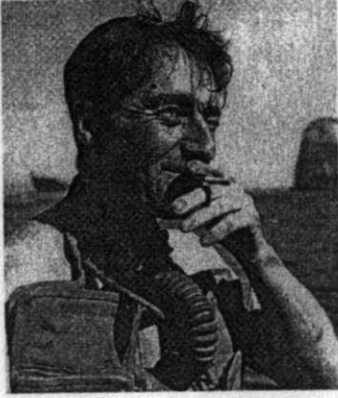
Lionel Buster Crabb. Ünlü kurbağa adam, ajan. James Bond ondan esinlenerek kurgulandı.