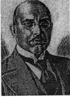
Max Ervin Scheubner-Richter. Birinci Dünya Savaşı'nda Erzurum'daki Alman ajan. Hitlerin dostuydu.