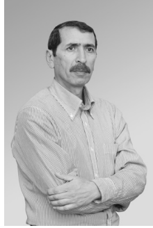
OSMANLI (Deyanet Osmanlı) 1965

Gürcistan'daki eski Türk yurdu olan Borçalı'da doğdu. 1991 yılında Bakü Devlet Üniversitesi gazetecilik bölümünden mezun oldu. Azerbaycan edebiyatında kendine özgü üslubu olan yenilikçi şair olarak bilinmektedir. 1992 yılında basında yayınlanan yaratıcı manifestosuyla tüm eski şiirsel kalıplardan vazgeçti. 1992 yılında yeni edebiyat uğruna çalışmalarıyla Avanguard Edebi Birliği'ni oluşturdu ve onun başına geçti. "Beyaz kitap" (1997), "İlk ... Ve ... Son ... (2009) isimli şiirler ve birkaç düzyazı kitapları yayınlandı. 2008 yılında Cumhurbaşkanlığı bursunu aldı. Azerbaycan'da Atatürk Merkezi'nin Genel editörüdür.