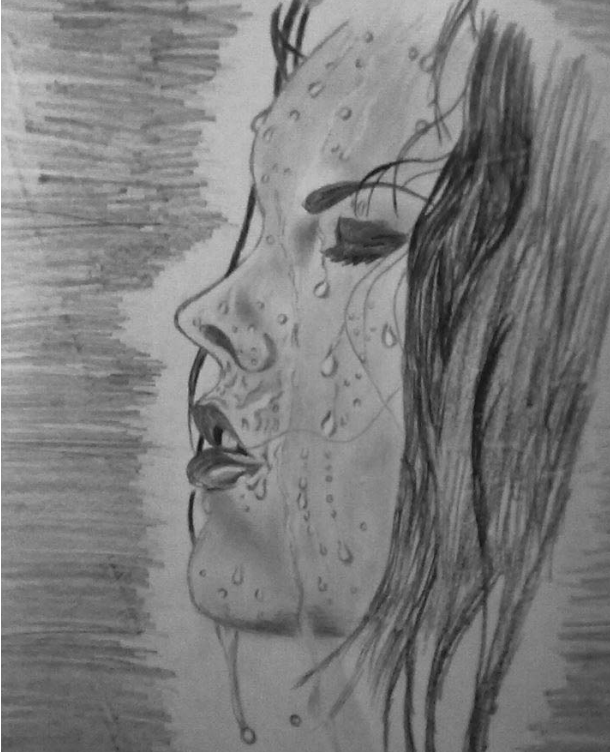
Rəssam: Fidan Kazımova