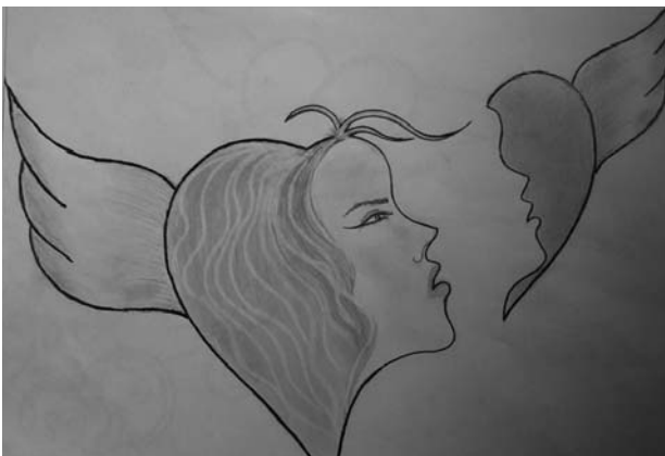
Rəssam: Fidan Kazımova

Güclü qadının qanadları var – qəlbinin Bəxtəvər başına! -- Qanadlı qəlim!