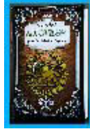
Araz Şəhrili - 50