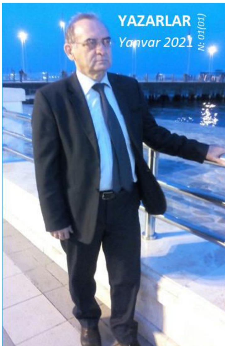
Ayət xan Ziyad (İsgəndərov)