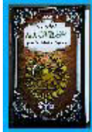
Araz Şəhrili - 45