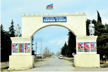
Kəndimizin ala qapısı