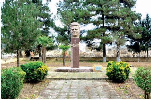
Sosialist Əməyi Qəhrəmanı Qüdrət Səmədovun büstü