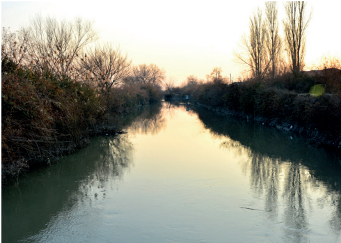
Bala Kür - Ağquşa çayı