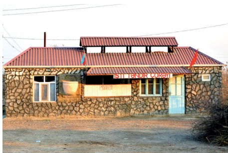
Kiçik ticarət mərkəzi