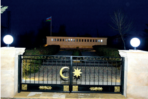
Sarvan Şəhidlər Xiyabanı