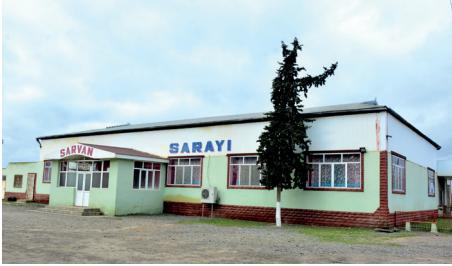
Kəndimizin şadlıq evi