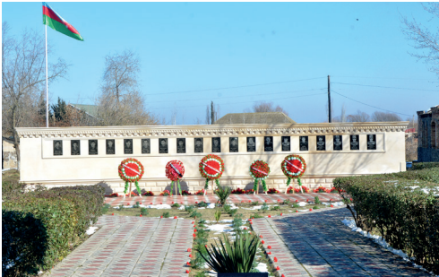
Sarvan Şəhidlər Xiyabanının görünüşü