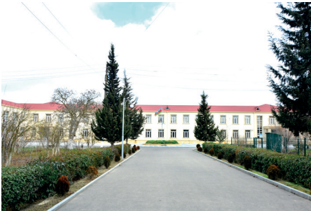
İ.Həsənov adına Sarvan kənd tam orta məktəbi