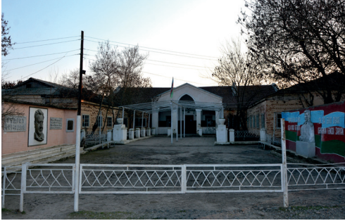
Salman Əliyev adına klub