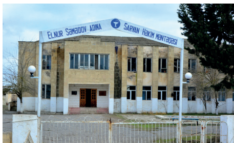
Elnur Səmədov adına Kənd Xəstəxanası