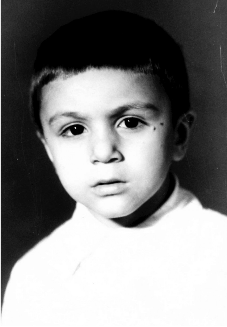
İlqar baxçanın ən cazibəli uşağı idi