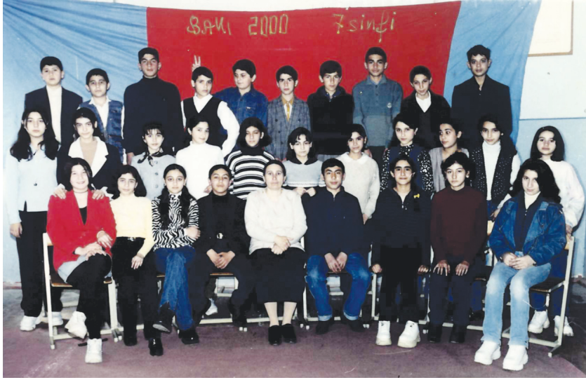
Yaddan çıxmayan orta məktəb illəri