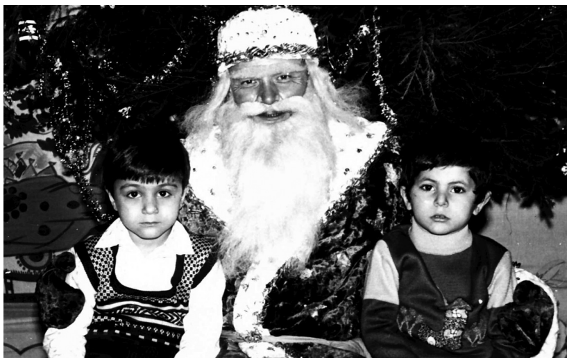
İlqar şaxta babanın gəlişini səbirsizliklə gözləyirdi