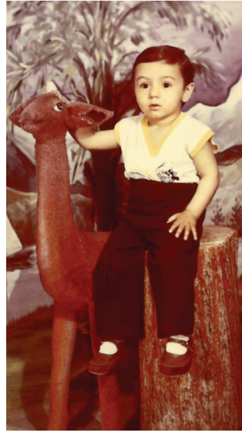
Vüqarın vüqarlı dünyası