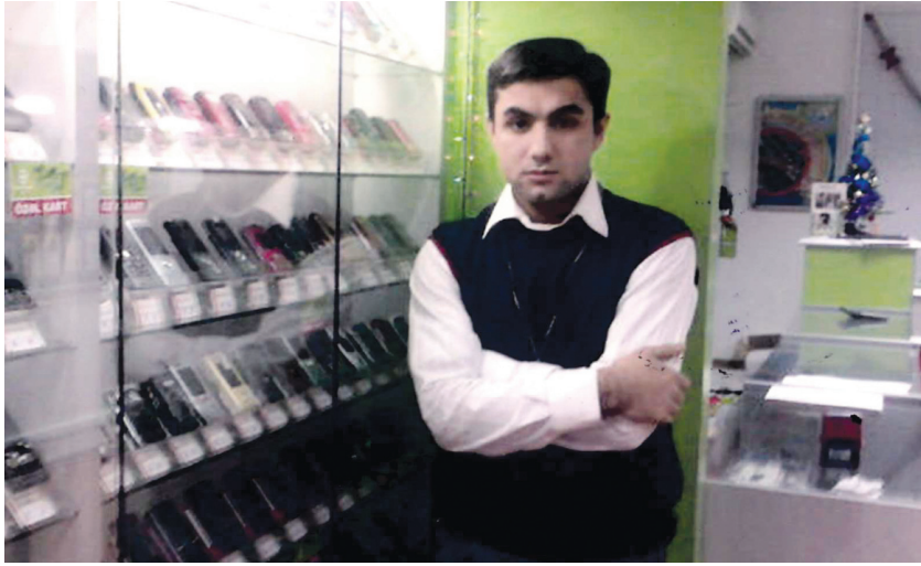
Vüqar iş yerində