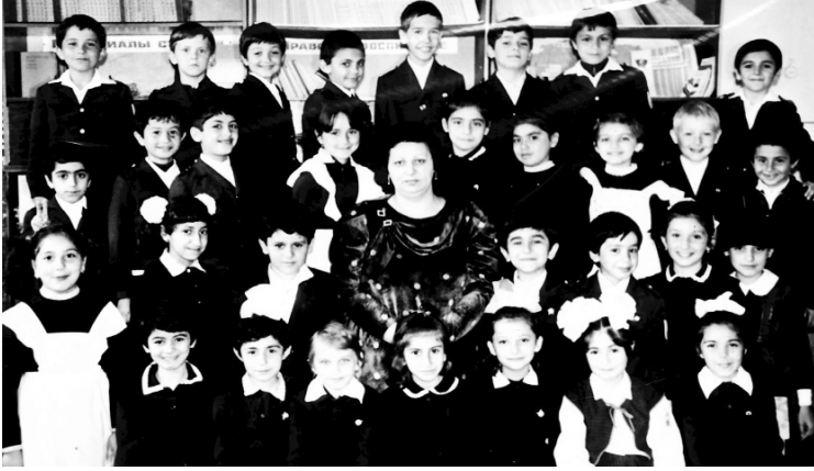
İlqar sinif yoldaşları arasında özünü xoşbəxt sanardı