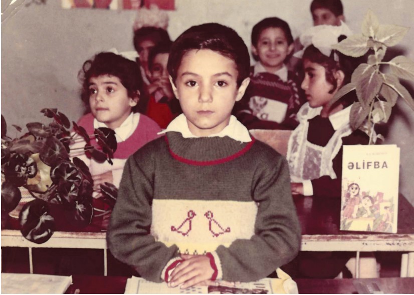
Vüqar ön cərgədə oturmağı çox sevərdi