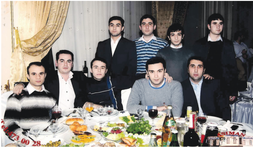
Vüqar iş yerində yolşadşları ilə