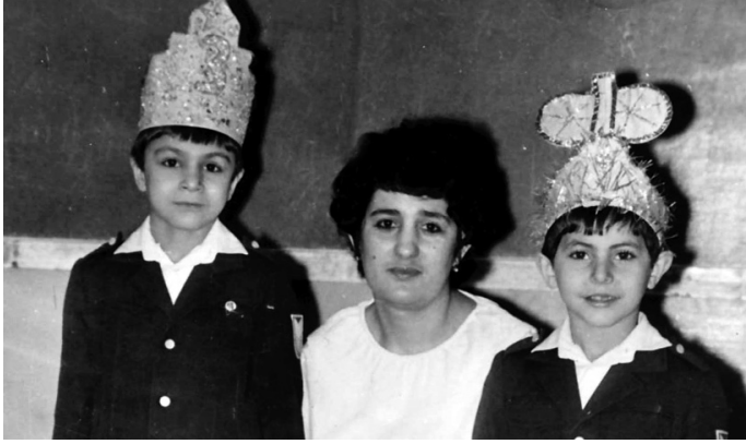
İlqarın uşaqlıq illəri