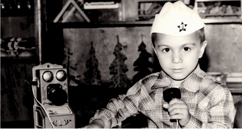
İlqar Leyla xanımın döyünən ürəyi idi