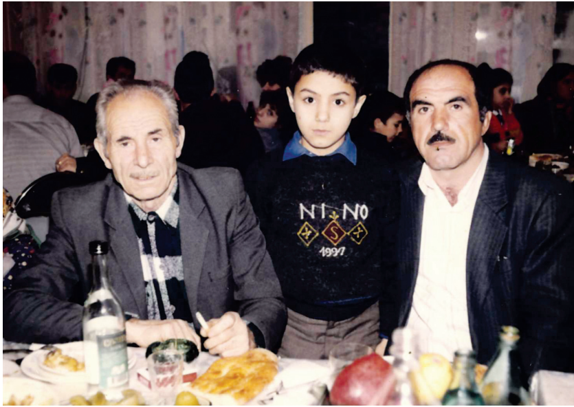
Babanın nəvə sevinci. Atanın oğulu ilə qürurlandığı anlar. O günlərə gün çatmazdı...