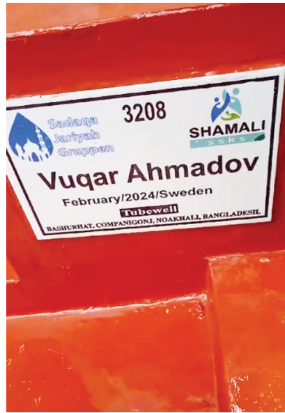
Banqladəşdə İlqar və Vüqarın adına açılan bulaq