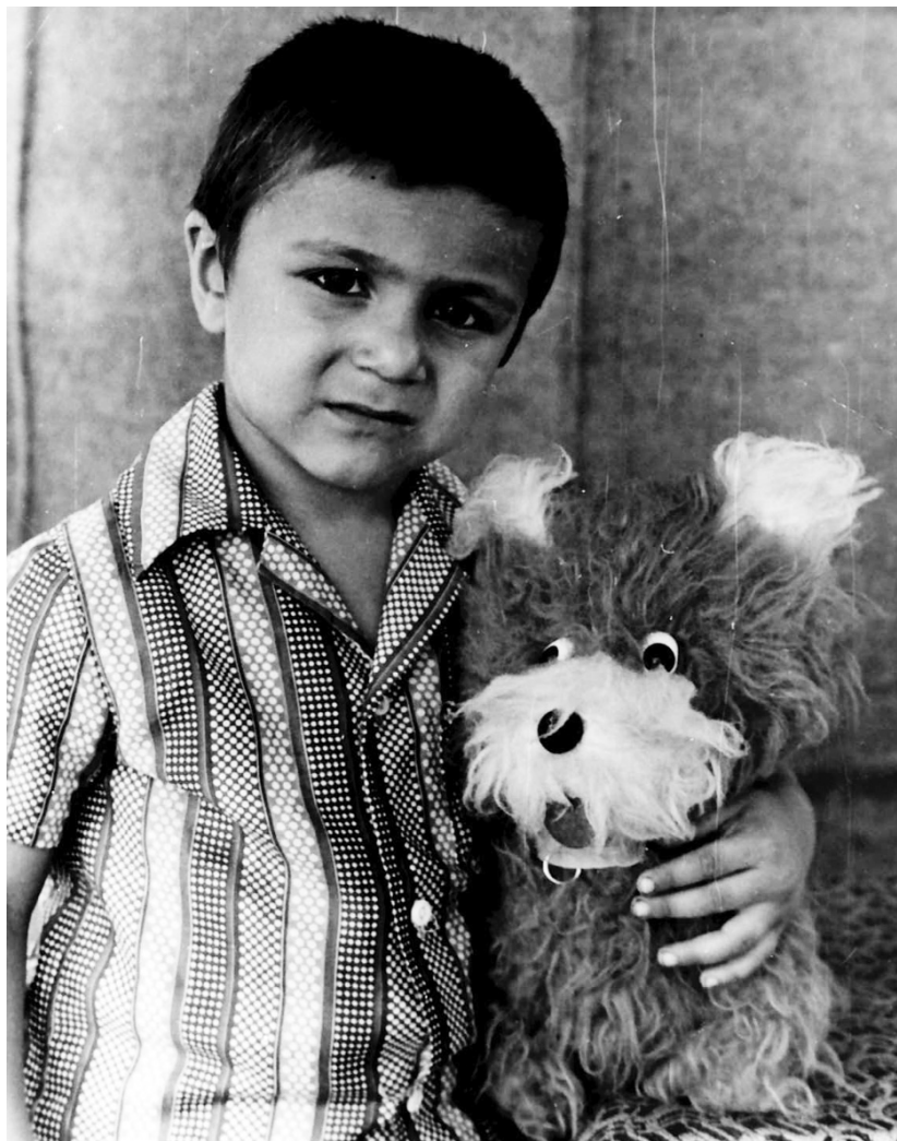
İlqar oyuncaqları çox sevərdi