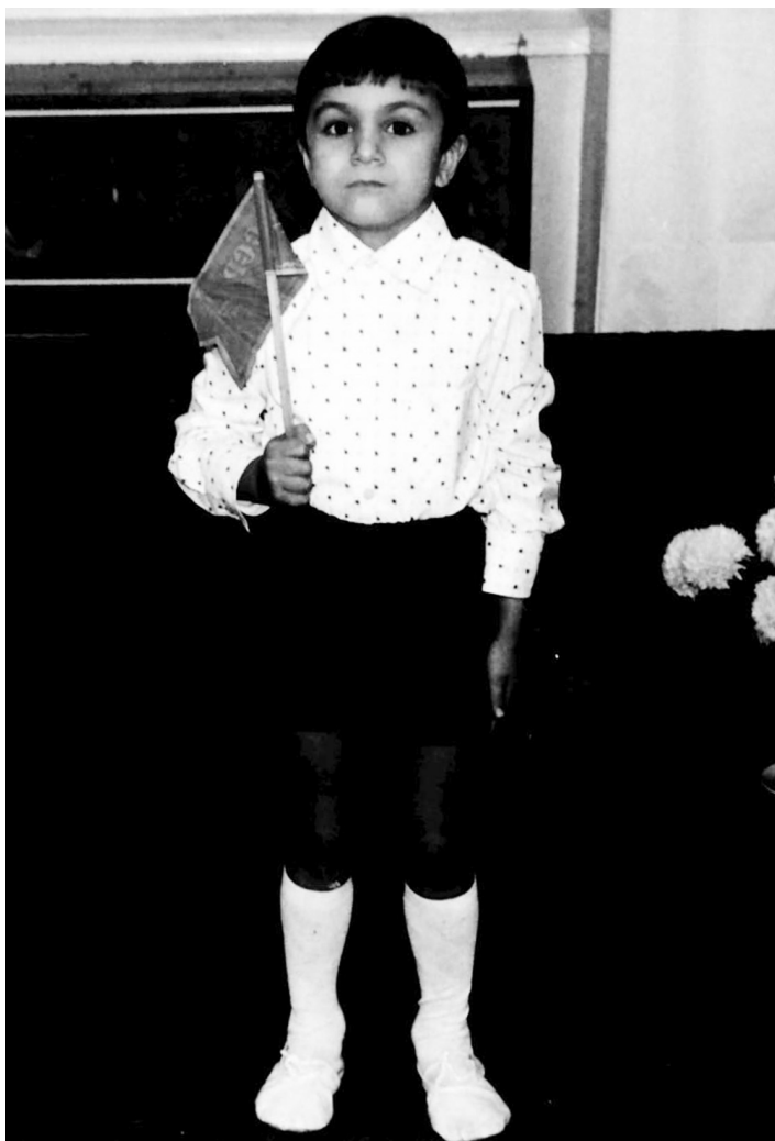
İlqarın baxçada keçən günləri