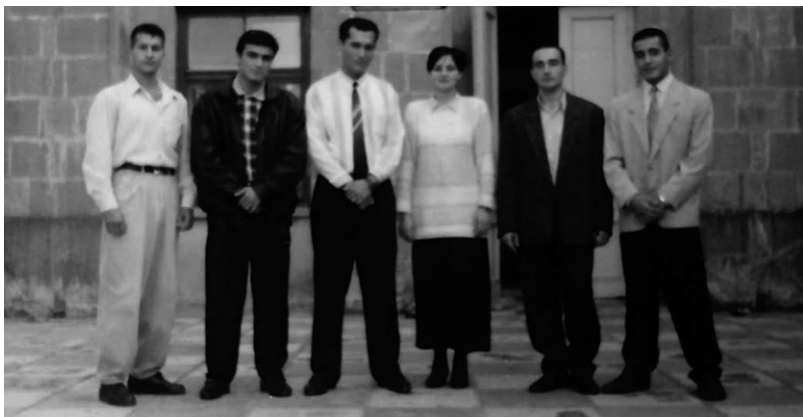
İlqar yoldaşları ilə