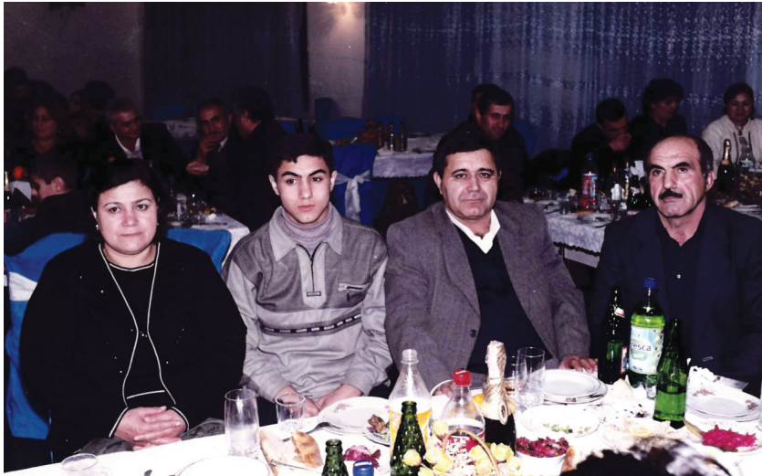
Vüqar doğmaları ilə toy şənliyində