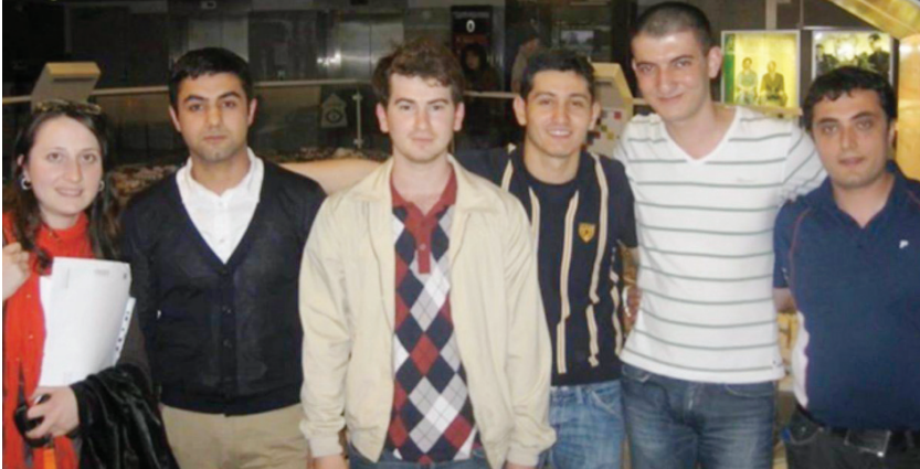
Stokholmda. Vüqar gənclər təşkilatının iştirakçıları ilə