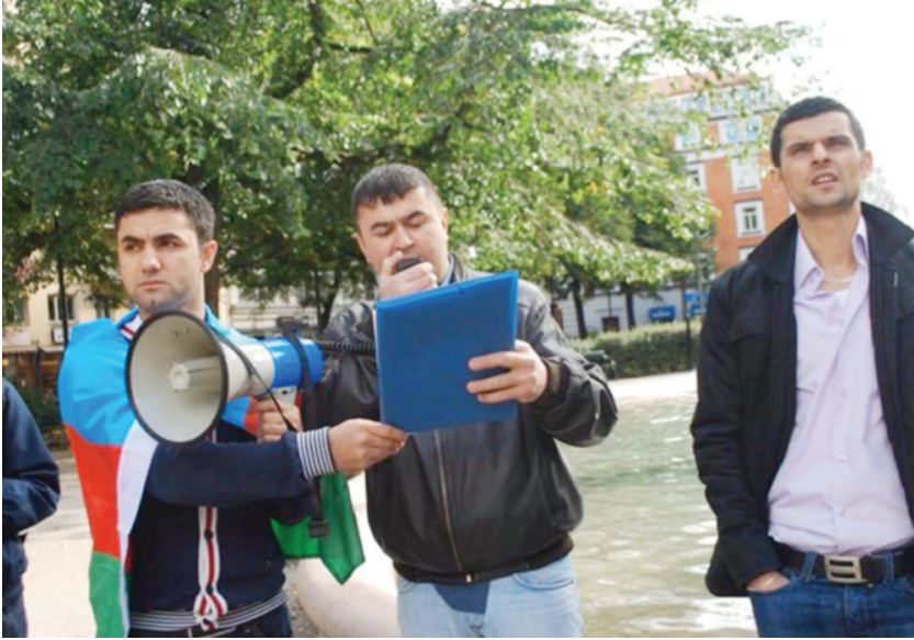
Vüqar Stokolmda nümayiş zamanı