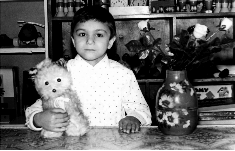
İlqar oyuncaqları çox sevirdi