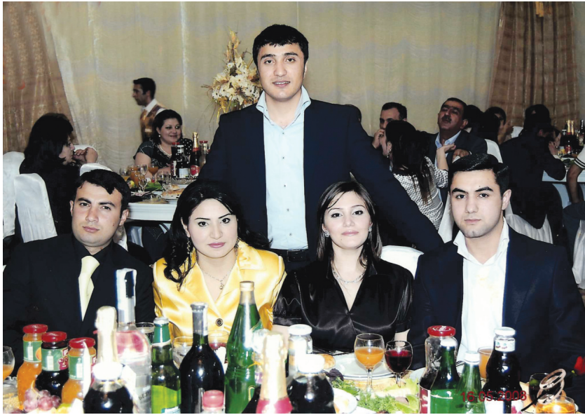
Vüqar qohumlarla toy məclisində