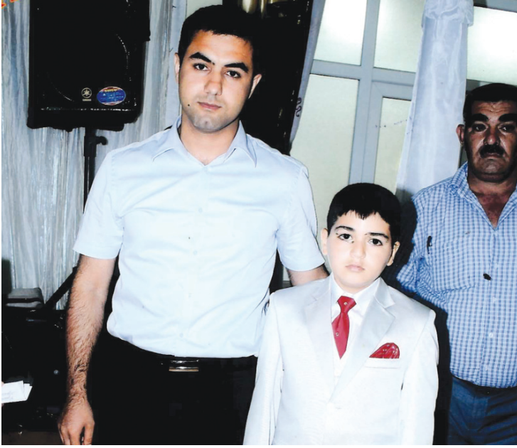
Səbuhi kirvəsi Vüqarla